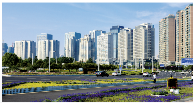
CBD的总部经济越来越发达

四是对外开放功能。国家中心城市是以国际经济贸易和国际文化交流为核心的区域开放门户,代表国家参与国际竞争与合作,与世界各国建立广泛的政治、经济、文化交流,促进跨国城市之间的联系,推动不同区域的资源整合。