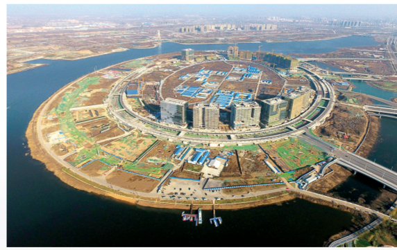
正在建设中的金融岛