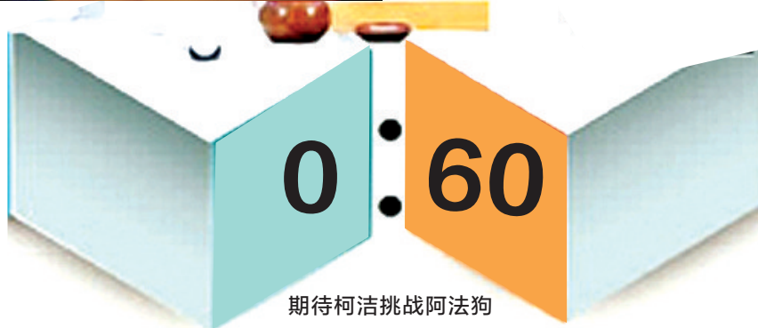
期待柯洁挑战阿法狗

谷歌 Deepmind:其实 Master 的本名是 Magister,是德国作家赫尔曼·黑塞晚年作品《The Glass Bead Game(玻璃球游戏)》里的一个词。一些围棋网络对弈平台(注:如弈城等)对于注册ID有长度限制,只能由六个字母组成,于是我们把“Magister”缩写成了“Master”。这里并没有什么挑衅意味,只是一个巧合。就好比阿法狗的名字,alpha是希腊字母表的第一个字母;有第一个,开端,最初的含意。而“Go”就是围棋的意思,所以阿法狗就是“围棋里最初一步”的意思。