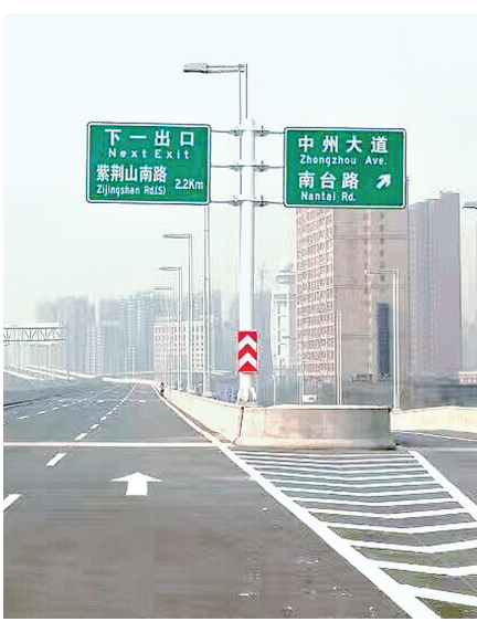
南台路、中州大道下桥口

高架中州大道与机场高速郑州南收费站实现了快速路双向互通。需要提醒的是,南三环东段车辆上中州大道的,需在南台路提前下桥,走地面道路再上中州大道。