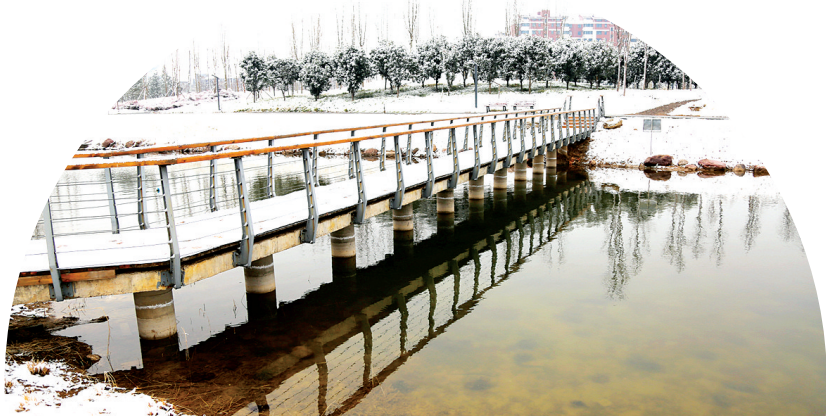
流水小桥 拍摄于龙子湖湖心小岛