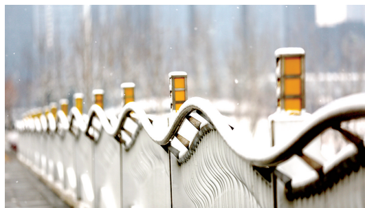
望龙西桥护栏小景 拍摄于望龙西桥