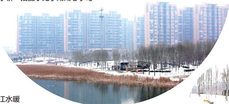
春江水暖 拍摄于望龙东桥