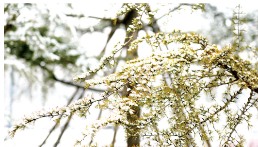
二月初惊见翠芽 拍摄于明理路平安大道