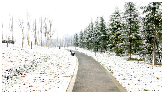
龙子湖小径 拍摄于龙子湖南路沿湖绿化带