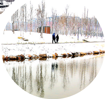
湖光山色踏雪行 拍摄于龙子湖湖心小岛