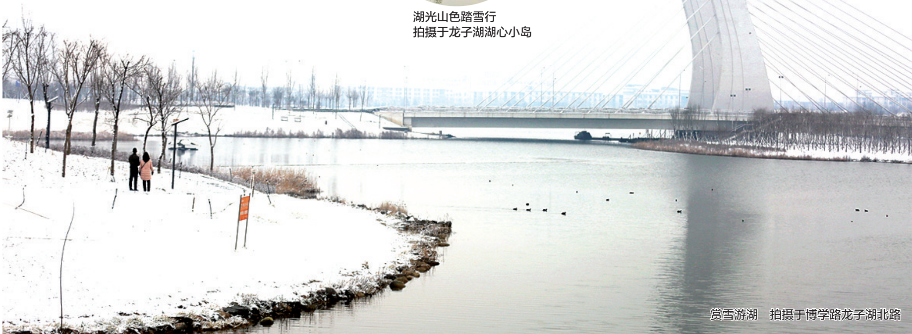
赏雪游湖 拍摄于博学路龙子湖北路