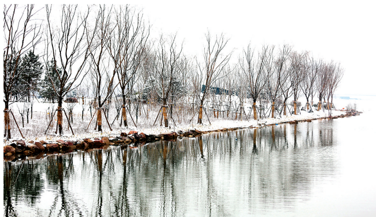
林花昨夜开 拍摄于博学路龙子湖南路沿湖绿化带

新年都未有芳华,二月初惊见草芽。白雪却嫌春色晚,故穿庭树作飞花。点点晶莹装点着还未吐露的芬芳,为早春的龙子湖畔增添了一抹别样的美。