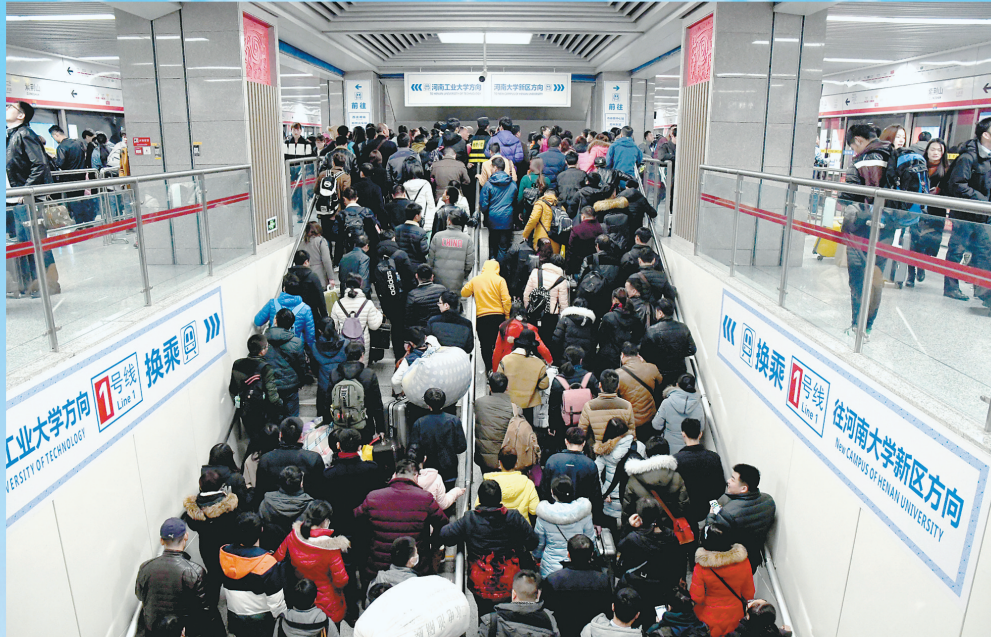
下班高峰期的地铁紫荆山换乘站。

昨日,郑州9个空气质量监测点显示空气质量均为“良”。袁明浩表示,未来几天,受冷空气及降雪影响,我市空气质量仍将维持在良好状态。郑报融媒记者 侯爱敏