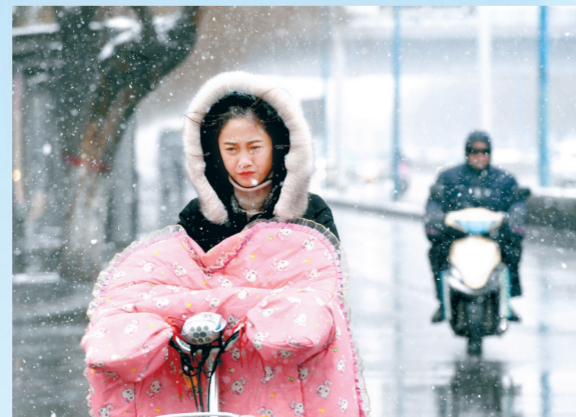
21日下午,花园路上,冒雪骑行的市民。郑报融媒记者 周雨 图

本报讯 2月21日,郑州市区普降雨雪,为全力保障市民出行,轨道公司根据气象预警,及时启动恶劣天气专项应急预案,1、2号线运营服务时间延长至24:00分(1号线为河南工业大学站、文苑北路站两端站对发;2号线为刘庄站、南四环站两端站对发);城郊线运营服务时间延长至22:00分(南四环站、新郑机场站两端站对发),另外,1、2号线及城郊线提前一小时进入晚高峰运营。郑报融媒记者 刘凌智