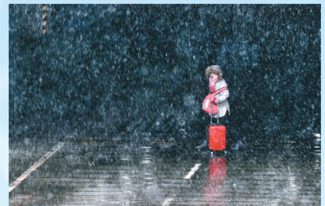
火车站西广场一女士在等车。