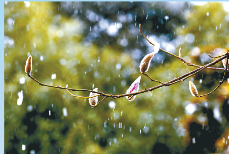
绿城广场,雪中即将开放的玉兰花。

本报讯 昨日,一场期待中的大雪如期而至,大家在欣赏雪景的同时,也享受到了沁人心脾的好空气。据预测,受冷空气及降雪影响,未来几天郑州空气仍将维持良好水平。