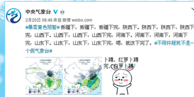
前天中央气象台微博发布卖萌预报。