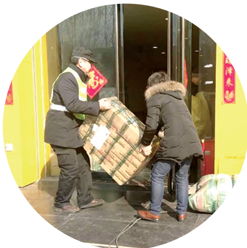
白鸽社区工作人员对店外经营行为进行处理

相结合。2016年4月份,中原区成立了大气污染防治专责小组,针对辖区露天烧烤、道路扬尘、渣土车带泥上路等实行24小时联合执法检查,在发现露天烧烤、占道突店经营、渣土车、道路扬尘等城市精细化管理方面的问题要第一时间通知相关责任部门及时处理;2016年6月份,又设立5个渣土车固定执勤岗、两个流动巡逻岗,坚持检查渣土车、物料车沿途遗撒和不按规定线路行驶,做到大气污染防治和城市精细化管理同步推进、共同治理。