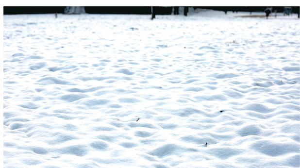
雪被 拍摄于熊儿河路沿河草坪