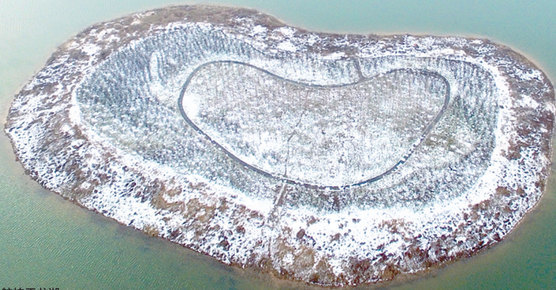
白雪皑皑爱情岛 航拍于龙湖