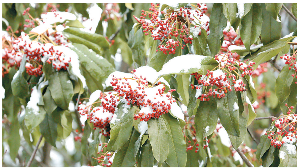
雪中一串红 拍摄于东风南路绿化带