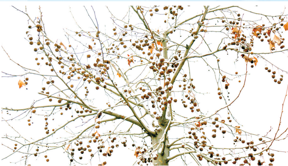
冰糖葫芦挂满树 拍摄于平安大道路边