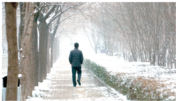
雪中行 拍摄于东风南路绿化带