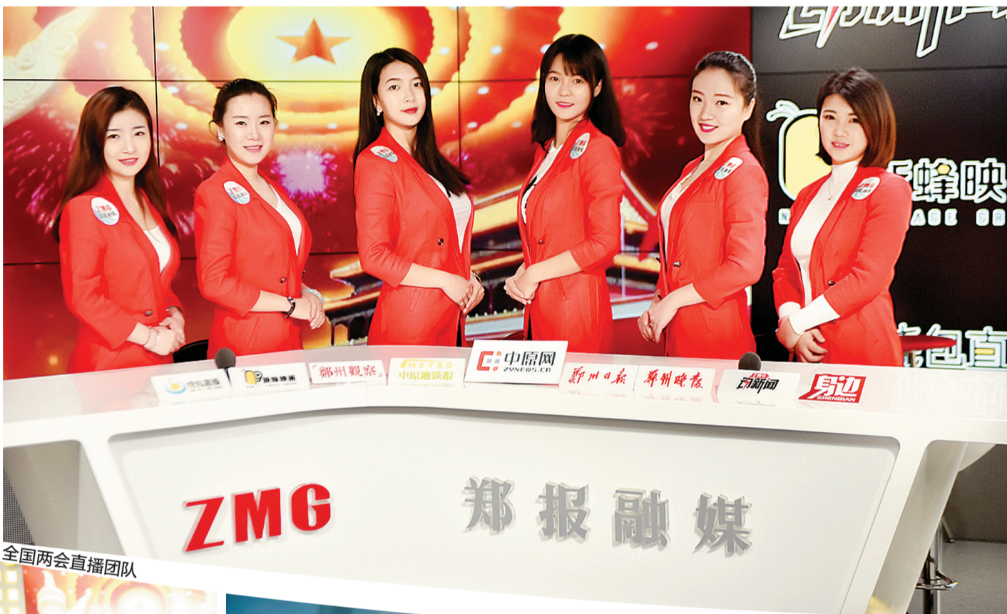
全国两会直播团队