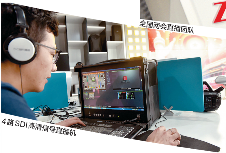
4路SDI高清信号直播机