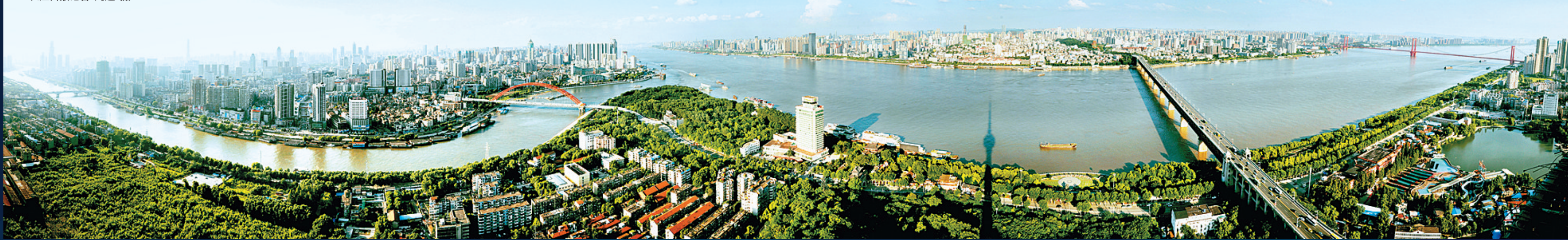
两江交汇,构成武汉独特的三镇格局,俯瞰两江,月湖桥、江汉一桥、晴川桥、天兴洲长江大桥、二七长江大桥、长江二桥、长江大桥、鹦鹉洲长江大桥映入眼帘

对外开放水平高,是西部内陆地区对外开放水平最高的城市。世界500强企业落户数量及外国政府驻蓉机构数量都遥遥领先。长江日报记者 张隽玮 汪文汉