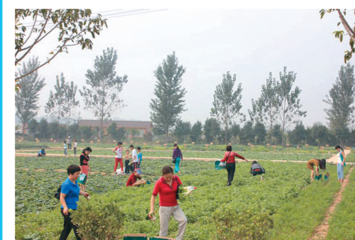
市民正在采摘蔬菜