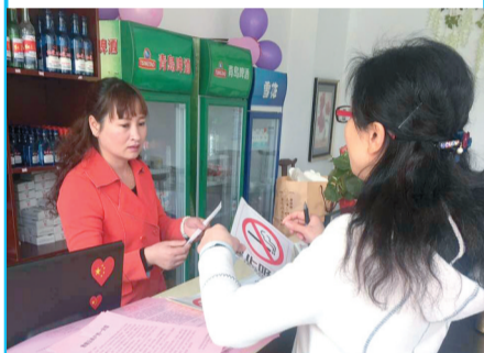
与商户签订“门前五包”

为加强城市管理，提升城市品位，进一步推进“双迎攻坚”工作，近日，祭城路街道办事处按照各网格工作进度安排，对辖区商户进行逐户宣传，发放《致辖区商户的一封信》，并落实签订“门前五包”责任书。