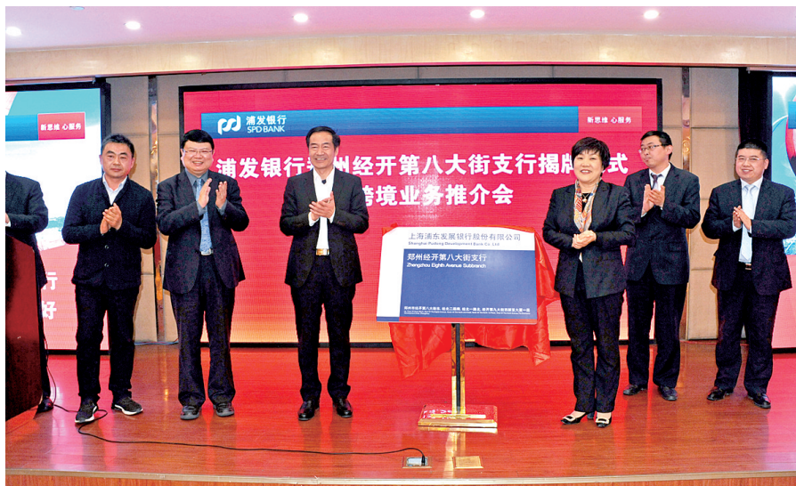
崔绍营为浦发银行经开第八大街支行揭牌并祝贺

3月29日,浦发银行郑州经开第八大街支行揭牌仪式及跨境业务推介会在经开区隆重举行,经开区党工委书记、管委会主任崔绍营出席仪式并致辞,浦发