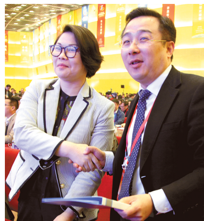
市长王新亭(右)代表荥阳市人民政府与恒大签约