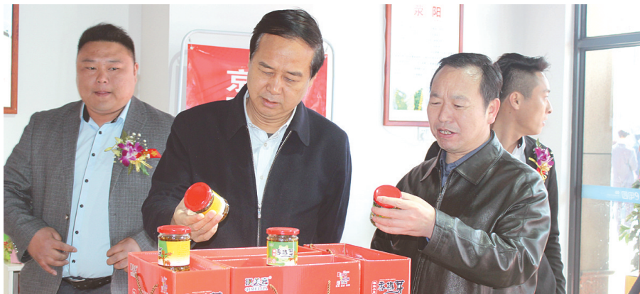
荥阳市委书记宋书杰(左二)到京东荥阳特产馆了解“互联网+”的运行情况

3月25日,荥阳e电园·郑西电子商务产业园在五洲城开园。在开园仪式上,荥阳市委书记宋书杰、荥阳市市长王新亭等致