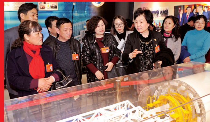
市人大代表参观郑州市“十二五”发展成就展