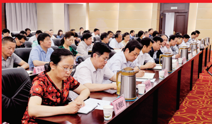
市人大常委会机关“两学一做”学习教育动员会召开