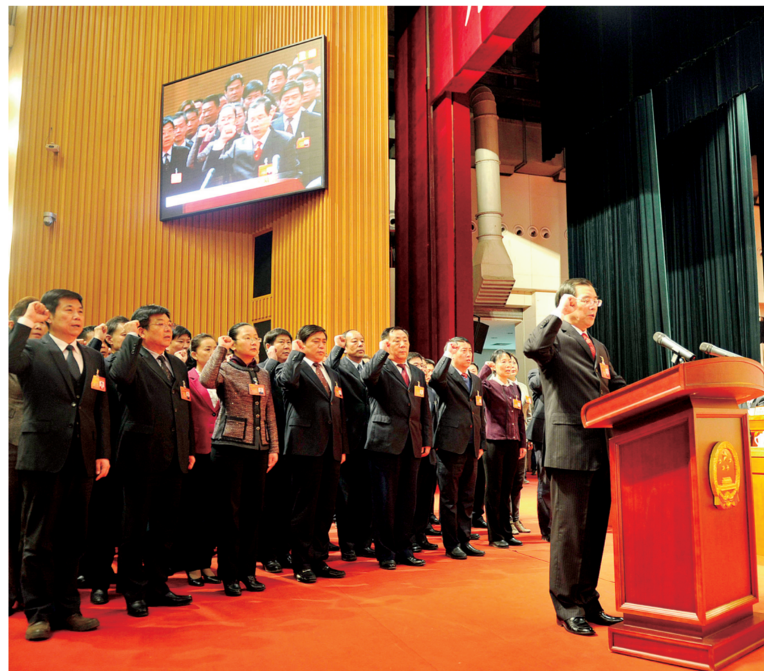
市十四届人大专门委员会组成人员进行宪法宣誓

尚属首例,得到市人大常委会领导充分肯定,认为“郑州市近几年立法工作紧扣经济社会和发展主题,突出地方特色,工作富有成效”。