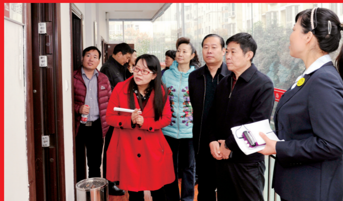
市人大常委会内务司法代表专业组开展调研活动