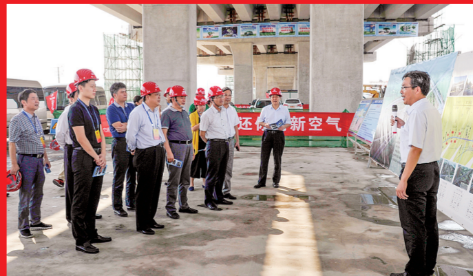
市人大常委会视察我市建筑工程管理工作情况