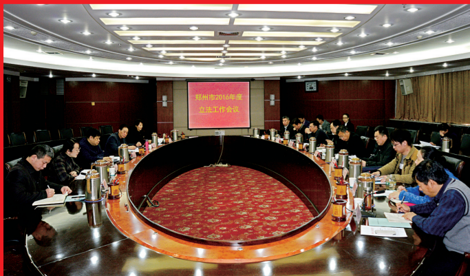
市人大常委会组织召开2016年度地方立法计划推进工作座谈会

发展。 其中,专项工作评议重提升;议案建议办理重质量……圆满完成了市十四届人大三次、四次会确定的各项任务。