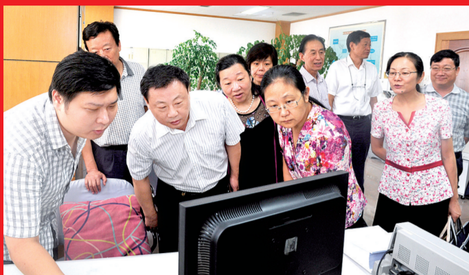
市人大常委会预算工委召开对市财政局财政国库管理制度改革工作评议前培训会