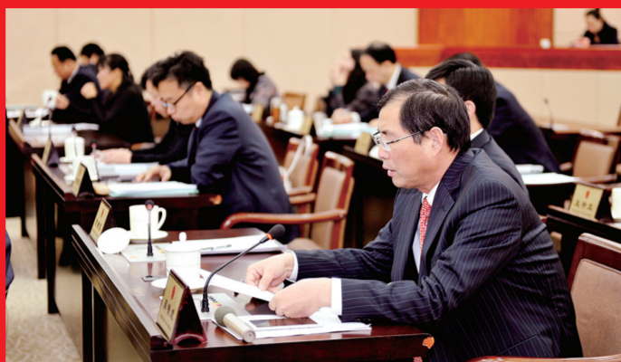
市人大常委会对市发改委、市公安局、市财政局等6个政府职能部门开展了专项工作评议