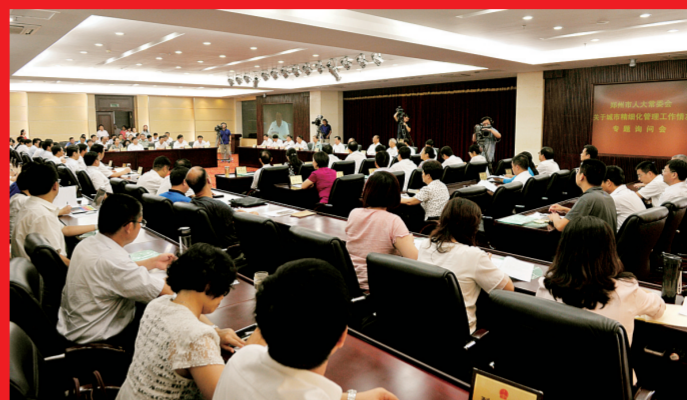
市人大常委会召开城市精细化管理工作专题询问会