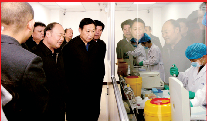
市人大常委会视察“十件实事”落实情况