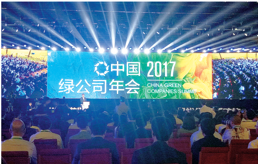
主会场

会上,加拿大国际贸易部长尚帕涅,中国企业家俱乐部主席、阿里巴巴集团董事局主席马云,中国企业家俱乐部副理事长、新希望集团董事长、民生银行副董事长刘永好等嘉宾分别进行致辞和主题演讲。