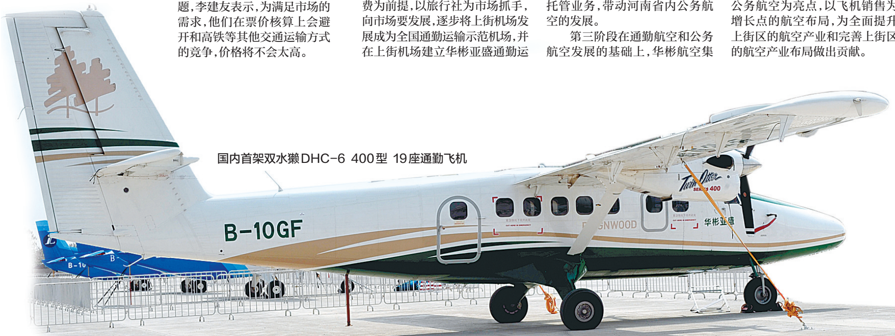
国内首架双水獭 DHC-6 400型 19座通勤飞机

最终通过4年3个阶段的投资和发展,华彬航空在上街区实现以通勤运输为切入点,以发展公务航空为亮点,以飞机销售为增长点的航空布局,为全面提升上街区的航空产业和完善上街区的航空产业布局做出贡献。