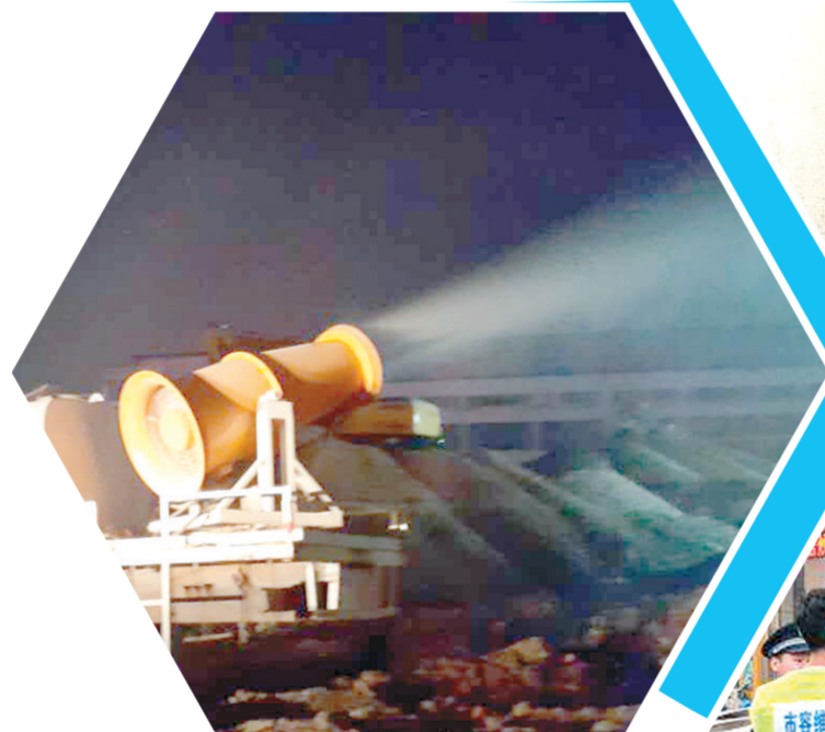
防尘雾炮车夜间还在工作

为切实做好迎接全国文明城市考评验收、国家卫生城市复审“双迎攻坚”工作,国基路街道办事处立即召开迎接国家卫生城市复审环境整治提升工作推进会,迅速行动,多措并举,强势推进,街道上下再掀“双迎”工作新高潮。 记者 鲁慧 通讯员 黄宁娅 文/图