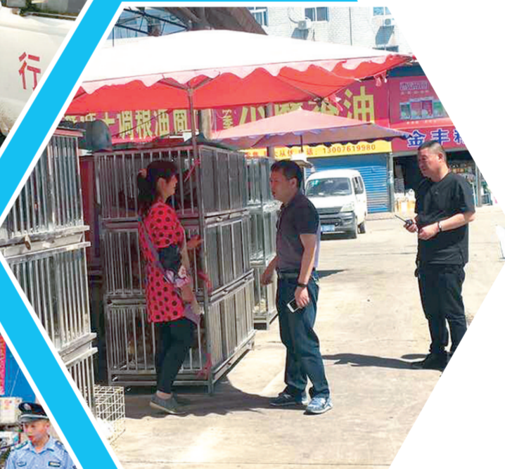
执法人员与商户沟通