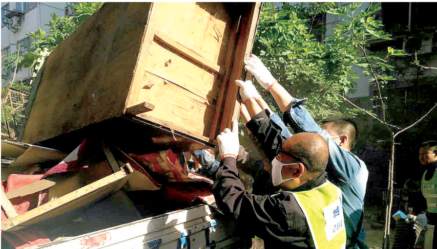
街道工作人员在清理辖区内废弃物品