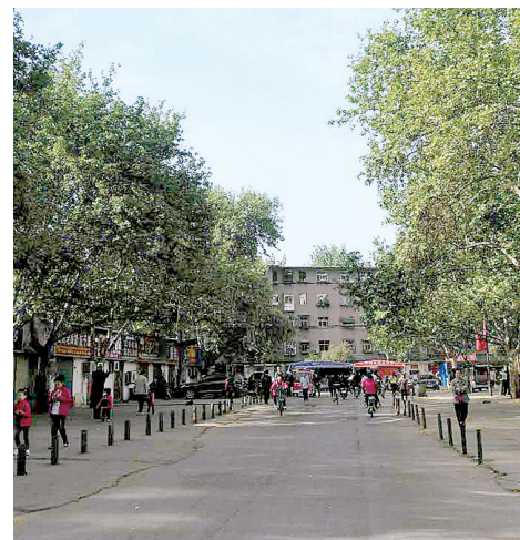
郑棉一厂家属区北门口变干净了