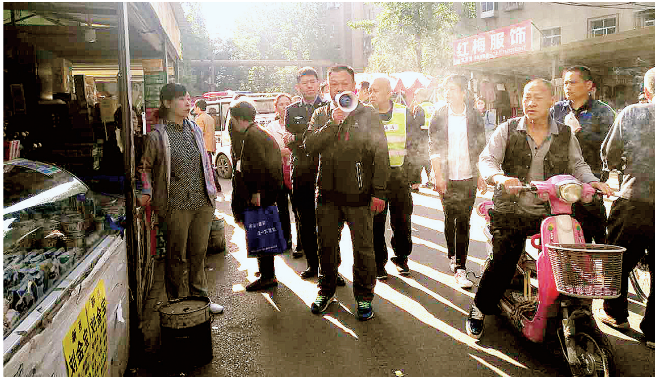
街道班子成员在小区内宣传“双迎攻坚”工作