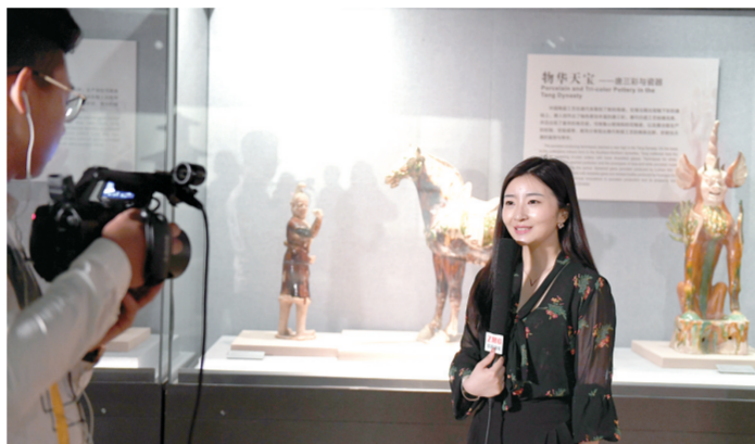
郑报融媒团队在直播现场

“这个印记可不简单,经专家鉴定是骆驼蹄印。”洛阳市隋唐城遗址管理处工作人员指着一个不起眼的小坑这样说,并解释说,蹄印之所以能够保存那么完好,可能是因为当时刚下过一场大雨,雨后转晴将地晒干,随后洛河又涨水,泥沙将它们覆盖封存,才得以保存到今。“定鼎门是公元7至10世纪丝绸之路东方起点都城洛阳的主入口,那个罕见的蹄印也成为见证洛阳丝路渊源的不灭印记。”