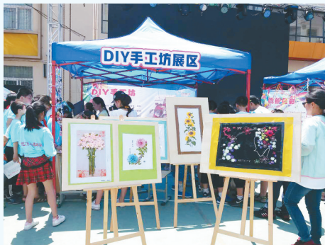
东风路小学DIY手工坊展区