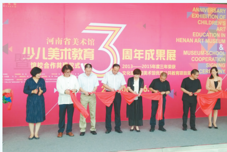
惠济区教体局与省美术馆签订协议

随着动感韵律的音乐节奏,一个个整齐有力的动作,一次次高难度队形的变换,小小队员们把篮球动作演绎得十分精彩:胯下绕球、双手拍球、抛接球、坐地拍球、圆形拍球……孩子们认真专注的表现赢得了在场评委和观众的热烈掌声。比赛最后,惠济区实验幼儿园的团体篮球操取得了一等奖的优异成绩。