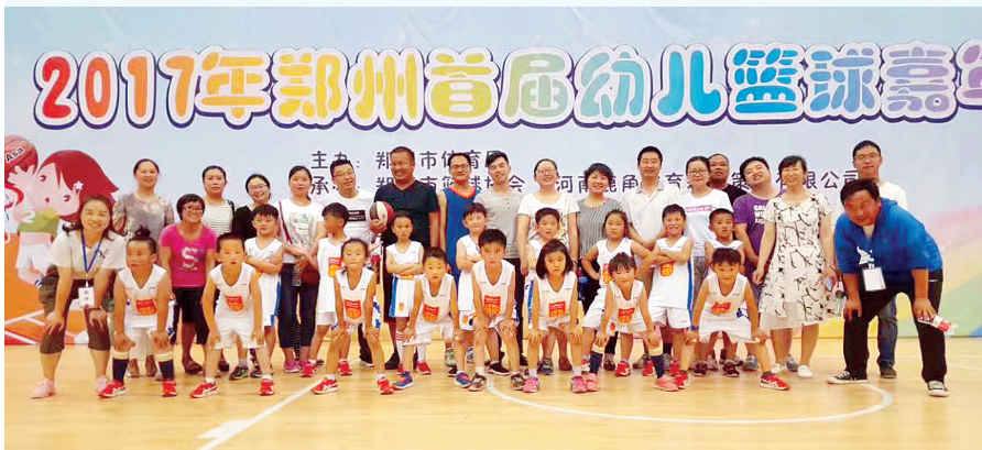
区实验幼儿园参加幼儿篮球赛的成员及教师、家长合影留念

惠济区实验小学承办全国教学展评活动;惠济区实验幼儿园团体篮球操在郑州首届幼儿篮球嘉年华中夺冠;惠济一中在“全国田径青少年训练工作会议”上获殊荣;惠济区教育局与河南省美术馆签订馆校合作协议……围绕“抓质量提升、建宜学惠济、圆强区梦想”,惠济区坚持增强教育实力,努力打造“宜学惠济”,为“未来”注入最强大动力。记者 简洋 通讯员 李恒 文/图