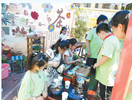
东风路小学嘉年华活动现场,学生积极参与