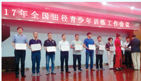
惠济一中在全国田径青少年训练工作会议上获奖