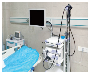
奥林巴斯260内镜系统