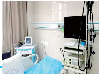
奥林巴斯V70内镜系统