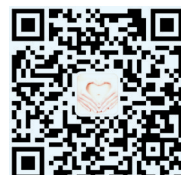
“子宫腺肌症” 微信公众号二维码

15617802607 微信预约 24小时接站服务,也可扫描二维码关注“子宫腺肌症”微信公众号,了解更多关于子宫腺肌症的保健与保宫知识。