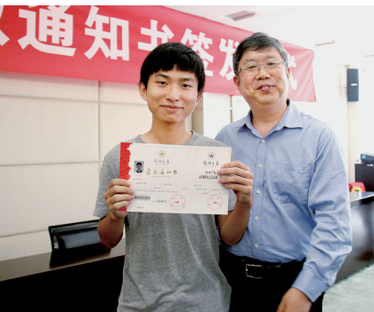
郑大校长刘炯天和领取通知书的新生合影

本报讯 2017年本科一批录取尚未完全结束,昨日上午,来自上海、山东、海南、陕西、河南5省市的15名郑州大学新生代表已经从中国工程院院士、郑州大学校长刘炯天手中接过了院士校长现场签名的录取通知书。 郑报融媒记者 张竞映 实习生 杨钰莹 文/图