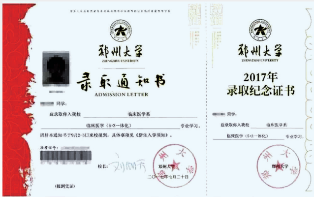
今年录取通知书专门设计了纪念版

本报讯 2017年本科一批录取尚未完全结束,昨日上午,来自上海、山东、海南、陕西、河南5省市的15名郑州大学新生代表已经从中国工程院院士、郑州大学校长刘炯天手中接过了院士校长现场签名的录取通知书。