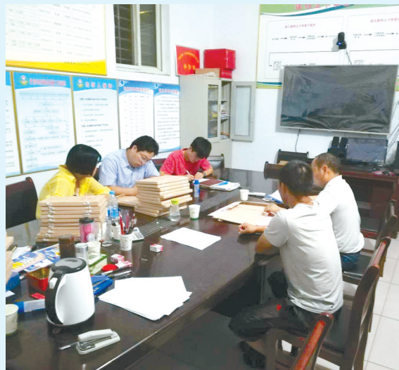
加班加点整理资料