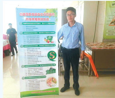
东风路食药监所工作人员正在发放食品安全宣传画。

为更好在辖区居民和各经营户中做好食品安全宣传工作,近日,东风路食药监所对辖区各食品、餐饮经营户发放创建国家食品安全示范城市的宣传画,鼓励辖区居民和各经营户认真学习,积极参与到创建国家食品安全示范城市活动中。