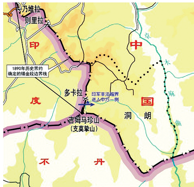
印军越界地点示意图