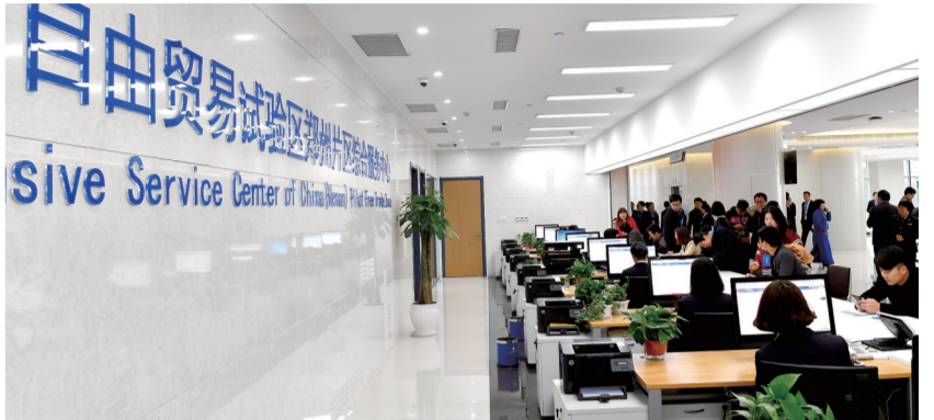
河南自贸区郑州片区综合服务中心