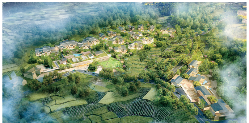
希望田野小镇效果图