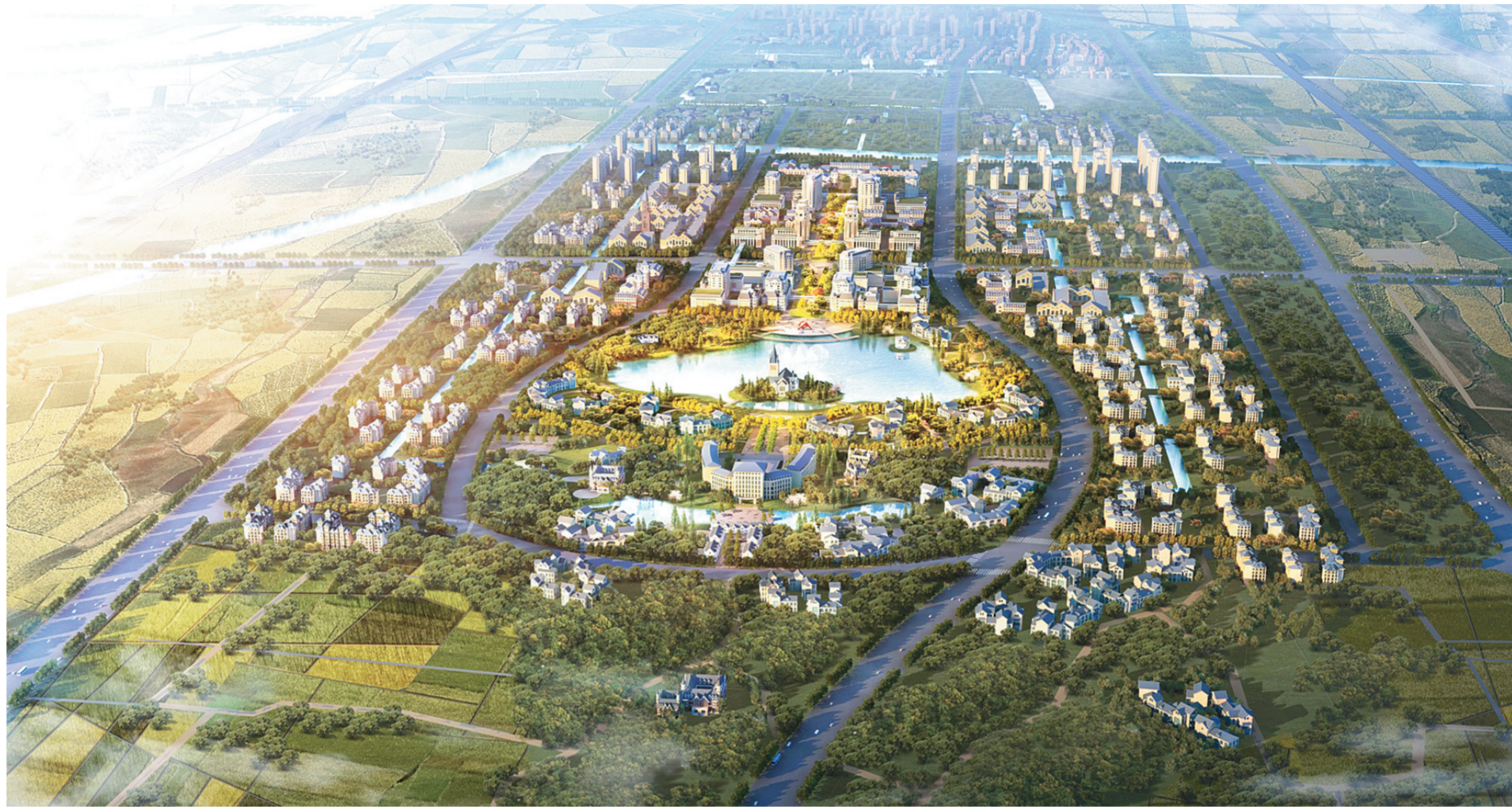
生物健康小镇效果图