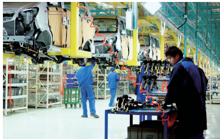
海马汽车打造了河南新能源“第一轿”