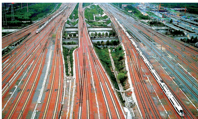
两列动车组列车驶入郑州东站(8月17日摄)。