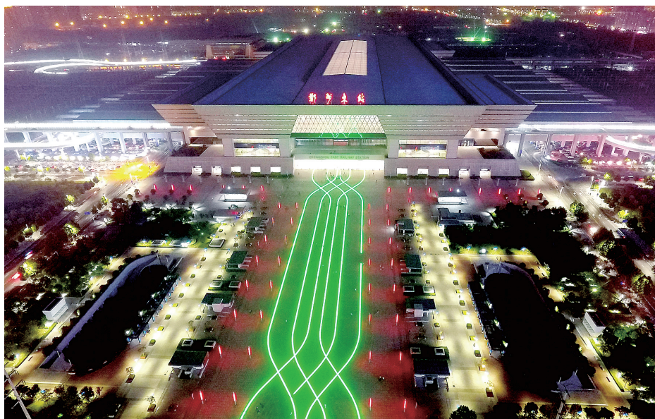
这是河南“米”字形高铁枢纽中心——郑州东站夜景(8月17日摄)。

以郑州为中心的“米”字形快速铁路网建成后,不仅承东启西、连贯南北,而且还可直接贯通华东、长三角至华北、西北,以及环渤海、西南地区甚至东南亚、孟加拉湾等地区,显著扩大国家快速铁路覆盖和服务范围,带动东中西城市群协同发展。