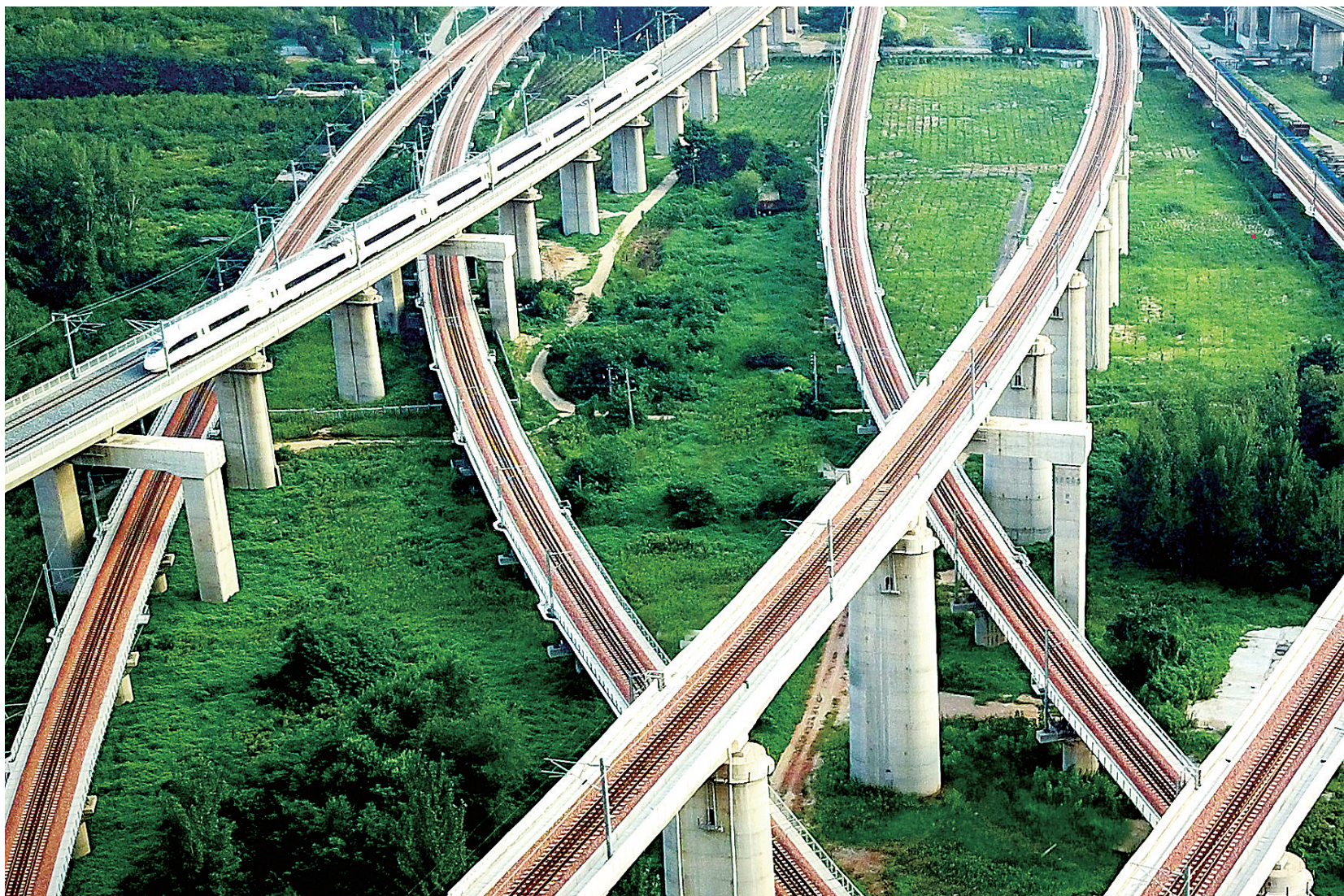
—列动车组列车从郑州市区内纵横交错的高铁线路中穿过(8月17日摄)。

以地处中原的郑州为中心,铁轨在大地上写了一个“米”字,构建起覆盖逾7亿人的两小时高铁网,这样宏伟的设想7年前还只是“纸上蓝图”,如今正在加速变为“地上通途”。