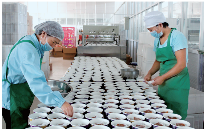
登封小仓娃有限公司安置贫困群众就业

本报讯“全面小康,一个也不能少。”近年来,郑州市委、市政府完善责任体系,因村因户因人施策,全力推进脱贫攻坚。8月18日,记者从郑州市政府获悉,2014年至2016年,该市共完成贫困村退出225个,贫困人口减少20360户80011人。