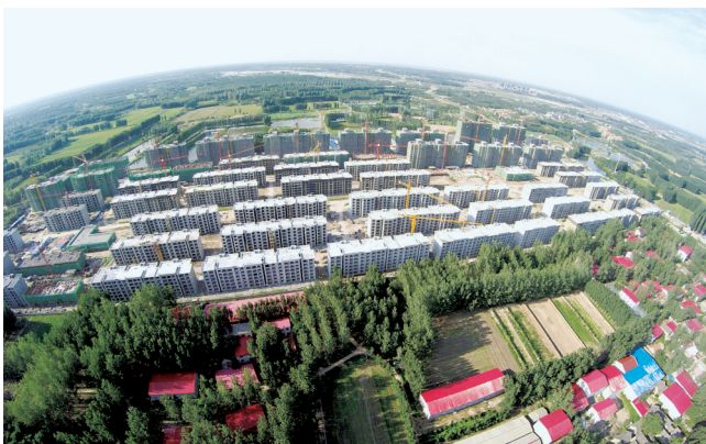
中牟大孟镇堤头社区

今日,本报转发《河南日报》这组报道,并连续推出郑州打好“四大攻坚战”系列解读,敬请关注!