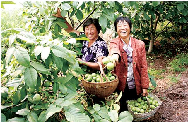
登封市颍阳镇于窑村核桃种植基地