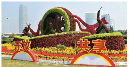
中州大道金水路立交花坛