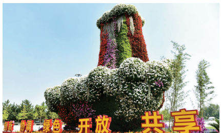
中州大道黄河路立交花坛