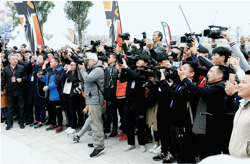
世界X-CAT摩托艇锦标赛郑州站比赛吸引众多中外记者聚焦