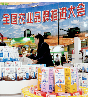
4月17日,全国农产品加工业发展和农业品牌创建推进工作会在郑召开,为农户和电商搭起沟通的桥梁。郑报融媒记者 丁友明 图

农村电商发展,电商人才是核心驱动。在农村电商培养方面,我市通过郑州电子商务大讲堂活动、以基础和实操为主题的培训活动、开展电子商务进农村专题培训和农村电子商务大巡讲活动等,为农村产业发展“传经送宝”。通过培训让农民真正了解电商、关注电商、学会电商、应用电商、离不开电商,通过电商这种形式实现农产品销售的提升,实现更多农户的脱贫,实现农村旅游和新农村建设的稳步发展。