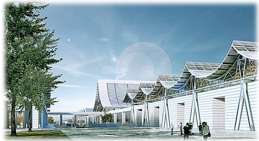
独特的波浪形屋顶

落户航空港实验区,航空、高铁、城铁、公路等交通条件得天独厚,波浪形屋顶和“服务盒”构成会展中心的基本元素,给人很强的视觉冲击力……昨日,郑报融媒记者对这个新国际会展中心进行了探访。 郑报融媒记者 王军方 文/图