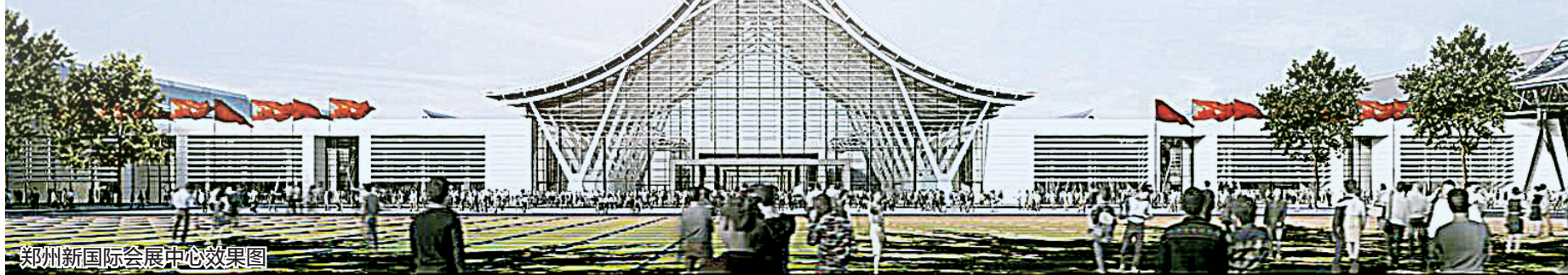
郑州新国际会展中心效果图