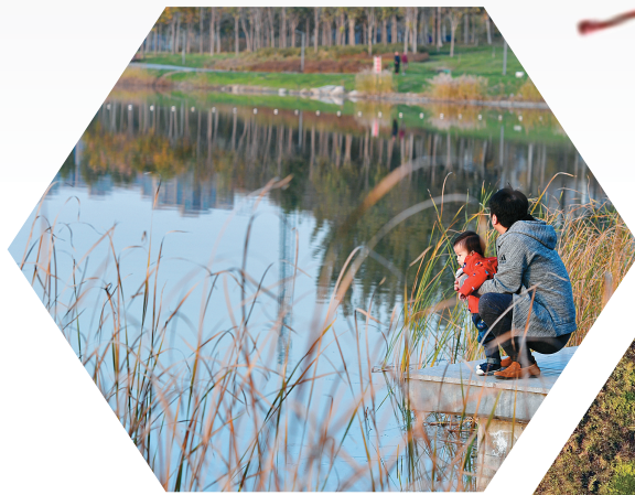
带孩子来湖边玩耍