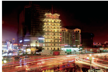
杨晋潼《二七塔夜色》