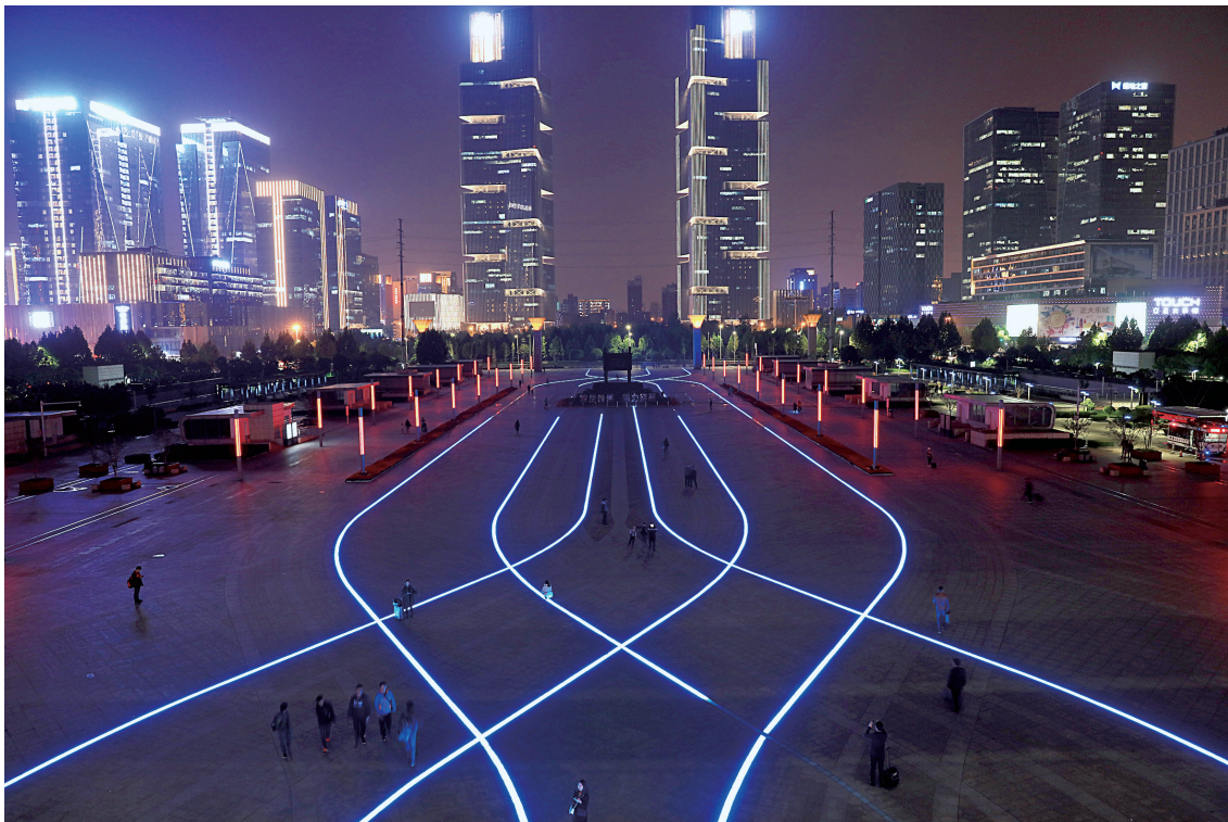
宋明《高铁广场夜景》