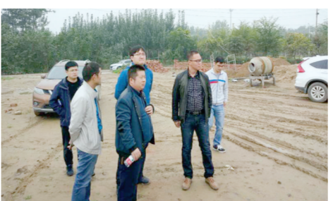
岗李水库专责组督导辖区内工地项目