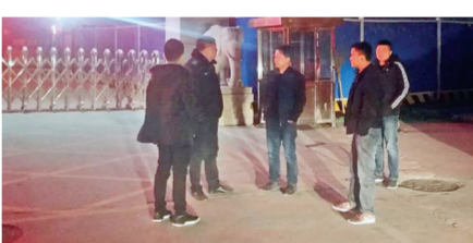
花园口镇进行夜查

连日来,花园口镇将扬尘污染治理、“散乱污”企业治理、散煤治理、农村人居环境治理等作为当前工作的重点来抓,出狠招、出实招,硬起手腕,为辖区群众营造干净、清爽的居住环境。第一时间召开会议传达省、市、区大气