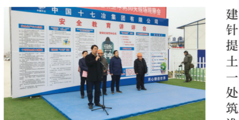
惠济区住建局召开全区建筑工地扬尘治理攻坚冲刺30天现场观摩会

13日,惠济区住建局组织辖区建筑工地项目负责人在大河社区项目现场召开观摩会,以观摩现场文明施工、交流扬尘治理经验,推进施工现场文明施工标准化建设。会议首先介绍了文明施工标准化