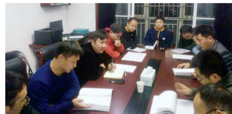
专责小组全力以赴创造性推进大气污染防治工作取得新成效

区委党校市控站专责组和岗李水库专责组全力以赴创造性推进大气污染防治工作取得新成效。