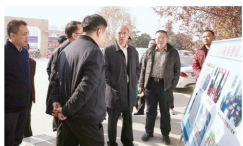
区委书记黄飏调研党校专责组工作给予充分肯定