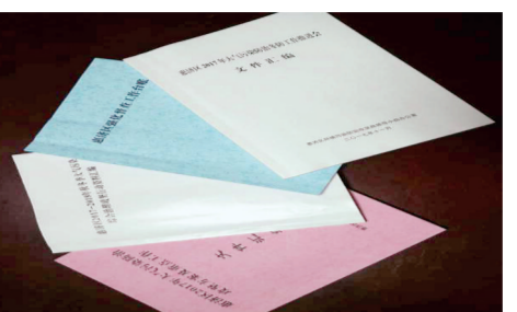
攻坚办建立健全各项工作机制