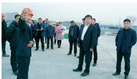
区委常委、常务副区长李伟光调研大气污染防治工作