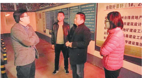
督导组夜间巡查工地项目