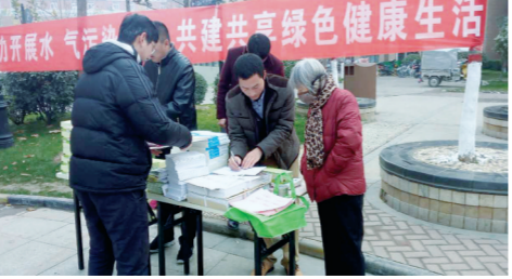
迎宾路街道办事处开展环保宣传活动