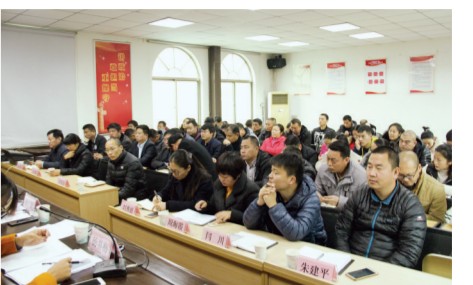
迎宾路街道召开大气污染防治攻坚战冲刺30天部署会