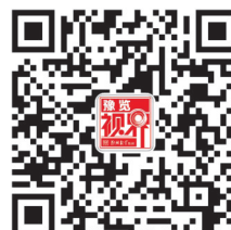
郑报豫览视界官微