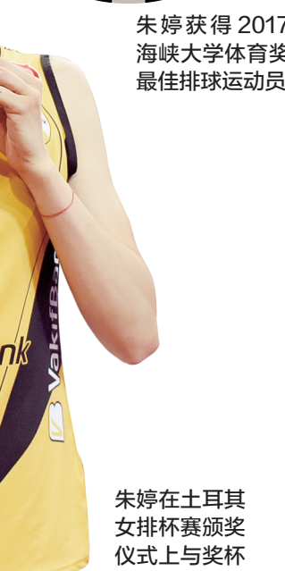
朱婷在土耳其女排杯赛颁奖仪式上与奖杯合影