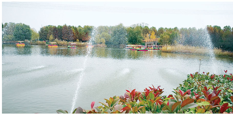
美景如画的中原区。通讯员 葛放 图

这一切的变化,都离不开中原区委、区政府的一系列举措和攻坚行动。一年来,区政府在市委、市政府和区委的坚强领导下,围绕国家中心城市建设,坚持“四重点一稳定一保证”工作总格局,统筹做好稳增长、促改革、调结构、惠民生、防风险等各项工作,全区经济社会持续平稳健康发展,生态环境持续改善,人民满意度、幸福感进一步提升。记者 张改华 通讯员 张亚芳 张晟