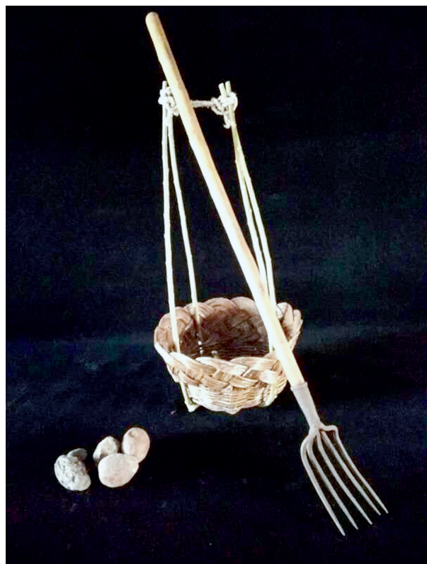
拾粪的粪箩筐和粪叉