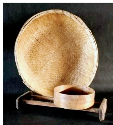
大布箩和箩床头,箩完整组