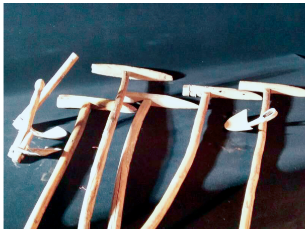
杀高粱铲和打高粱构完整组