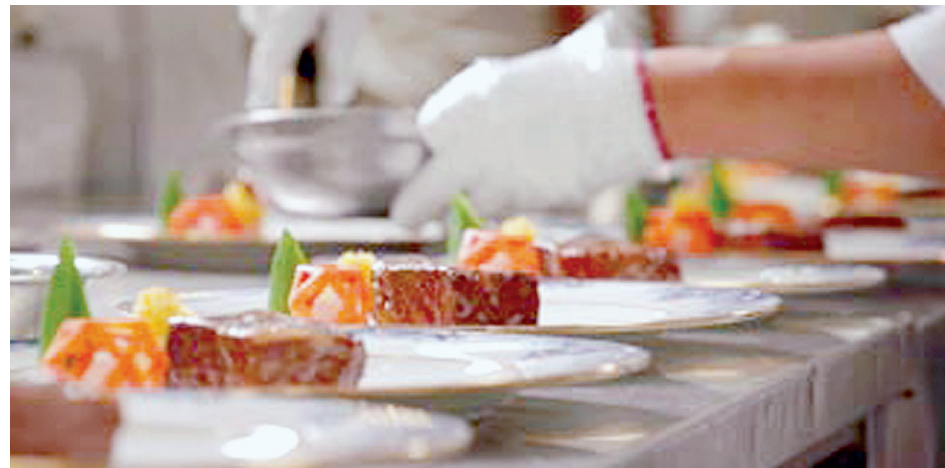
《舌尖上的中国3》年初四首播实时收视达到1.8

年初四,接灶神。这天也是吃货们翘首以盼的《舌尖上的中国3》正式开播的日子。时隔四年再度回归,《舌尖3》换上全新的制作团队,节目风格也悄悄地发生了改变:食物少了,故事多了,片头曲也换了……而改变带来的是争议:有人说《舌尖3》更具人文关怀,也有人说《舌尖3》变得“不下饭”了。