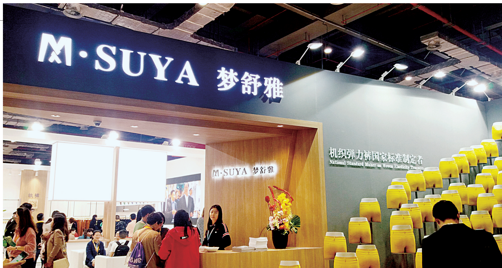
昨日上午,2018中国国际服装服饰博览会在上海开幕,郑州服装展团精彩亮相这一全球知名服装盛会。