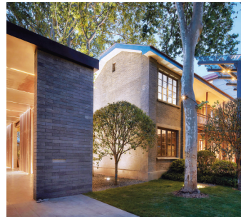
世珩售楼部现状——改造保留下的办公楼

建筑的风格,往往体现着这座城市的气质。要长久的存在,就要融入到城市的人文和历史中去。