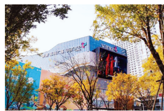
美景龙堂·万科广场

这样的郑州,你一定没有见过! 23日,一部名为《美好郑州》的3分钟快剪视频短片火遍朋友圈,温暖一群人,引发市民热议:原来幸福就在我们街头巷尾的车水马龙,公园漫步的微风阵阵,人文社区的美好场景…… 记者 王亚平