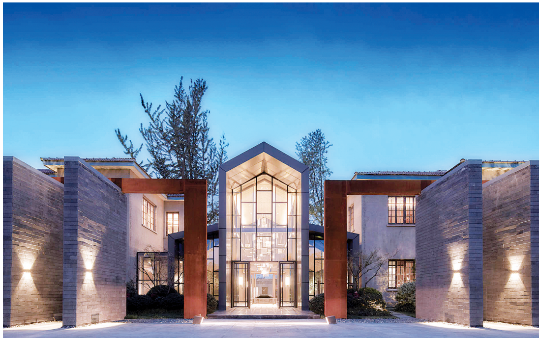
万科美景世珩会所

让更多老郑州人热泪盈眶的是,陪伴了郑纺机“一生”的老武装部办公楼被保留下来,万科对其进行加固、保护,成为项目售楼部,让新与旧并存、对比、交织,成功实现对老建筑的复兴。万科还保留了原郑纺机近70年的两排法桐大道,让其作为历史荣耀的象征,践行项目的情怀主义。