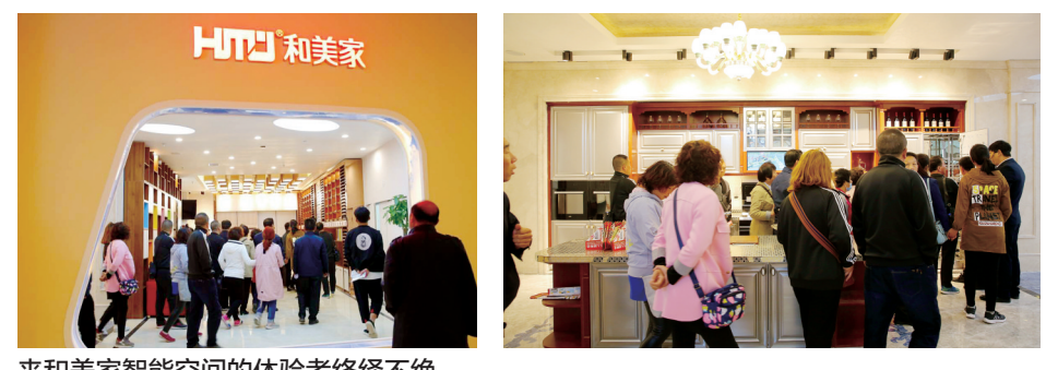
来和美家智能空间的体验者络绎不绝