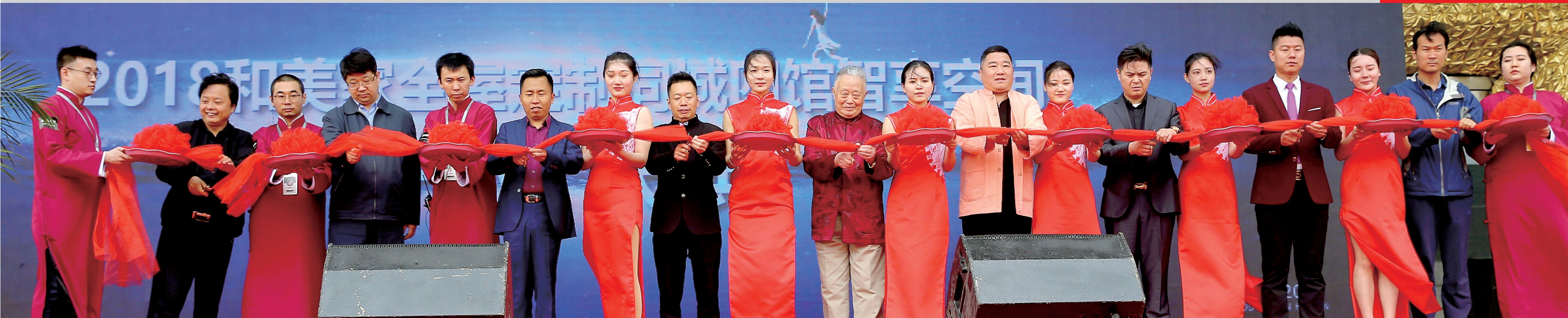
来自文化、科技、传媒、金融、实业等行业代表为和美家人工智能全屋定制体验馆开放剪彩