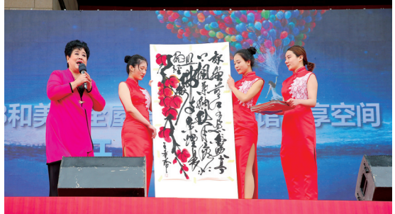
国家一级演员王希玲边唱、边写、边画赢得满堂彩