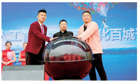
2018“赢响中原人工智能生态家”项目启动