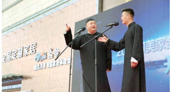
国家一级演员范军现场助力“河南智造”