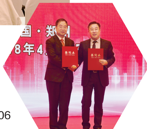
中国航天第十二研究院与郑州高新技术产业开发区签署战略合作协议