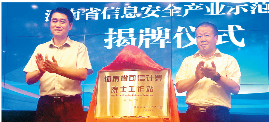
示范区内的河南省可信计算院士工作站揭牌

本报讯(记者 王翠 通讯员 范玺 张军燕 录青霞 索艳钊 文/图)为深入贯彻落实《河南省“十三五”信息化发展规划》和《关于贯彻落实〈国家信息化发展战略纲要〉的实施意见》,推动我省信息安全产业快速集聚发展,昨日上午,省工业和信息化委员会、郑州市政府在河南外包产业园会议中心举办河南省信息安全产业示范基地揭牌仪式。