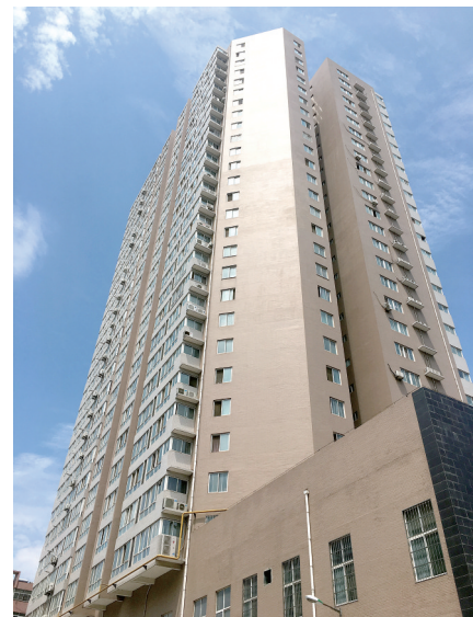
嘉华新苑小区两栋住宅楼其中的一栋