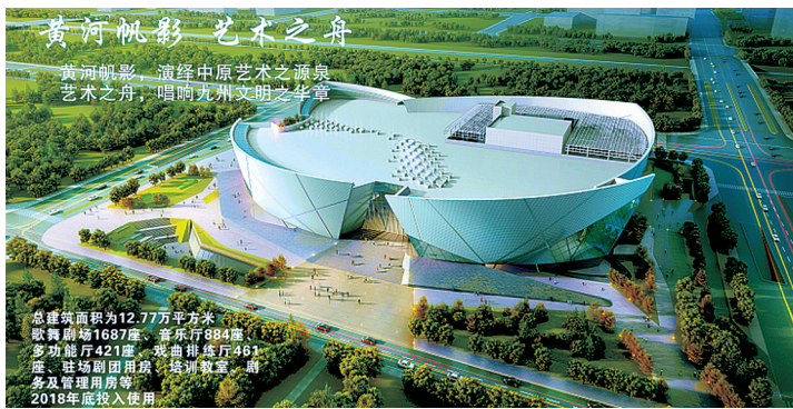
大剧院建成效果图

区域内轨道交通14号线、6号线以及两个车站奥体中心换乘站、临湖路站,总投资约20亿元,计划2019年3月底前投入运营。