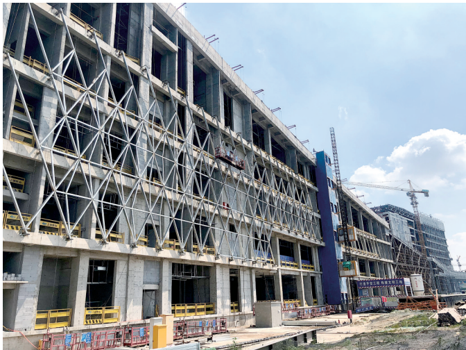
市民活动中心施工现场