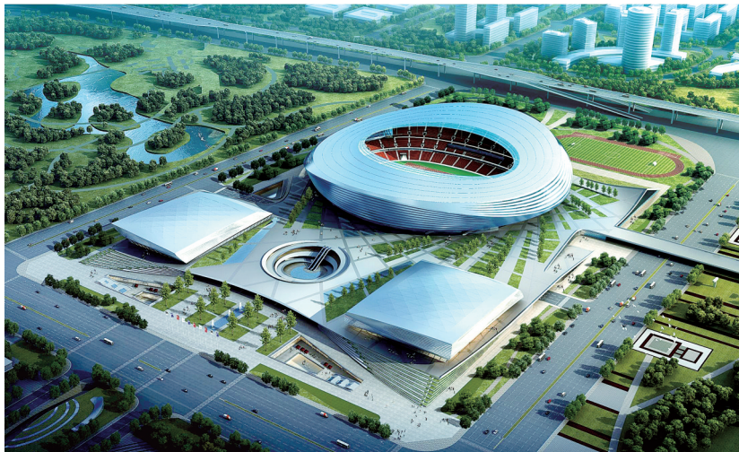
奥体中心建成效果图